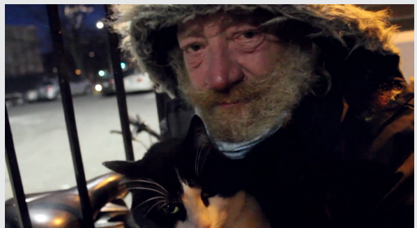
© Image tirée des ateliers de « scratching » sur pellicule avec l'artiste Guillaume Vallée, mars 2022

Ces ateliers furent rendus possible grâce au soutien financier de la Cassie de la Culture Desjardins