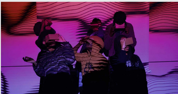
Image de La Maison d'Haïti « Le temps c'est mourir, créer à l'envers » (© Vanessa Suzanne) Image from La Maison d'Haïti "Le temps c'est mourir, créer à l'envers" (© Vanessa Suzanne).