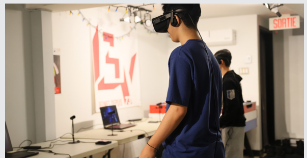
Image du Centre le Beau Voyage (© Tommly Planchat) Image from Centre le Beau Voyage (© Tommly Planchat).